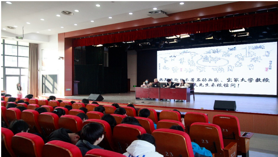
图 6-2 日本动漫协会会长月冈贞夫教授与学生交流