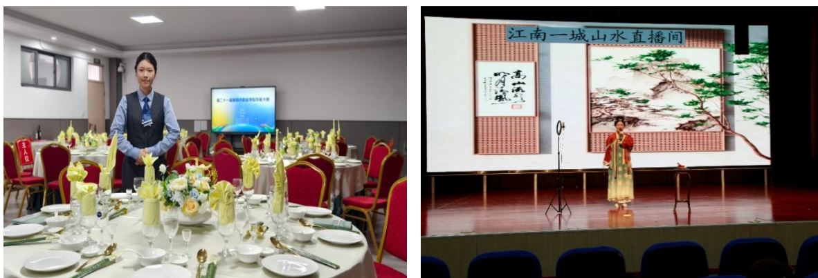
图 3-16 学校旅游类专业学生参加技能大赛现场

技能大赛中，学校学生共获江苏省级奖 6 项、苏州市级奖 17 项。在 2024 年江苏省学业水平考试中，学生专业技能合格率达 98.66%，全科合格率达 95.45%，人才培养质量有了显著提升。