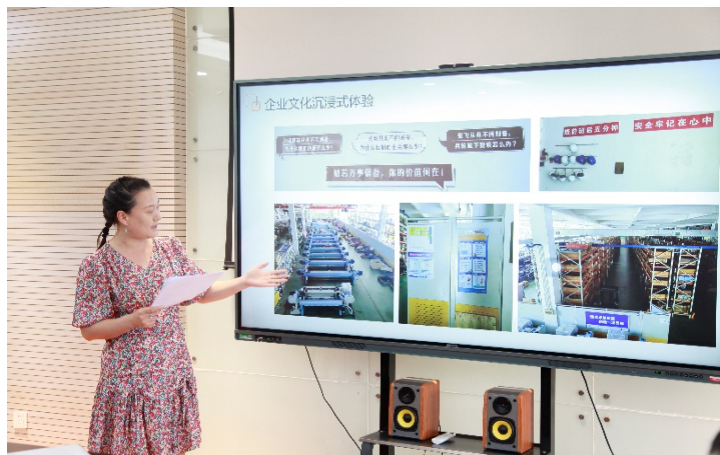
图 2-8 专业教师下企业期末考核汇报