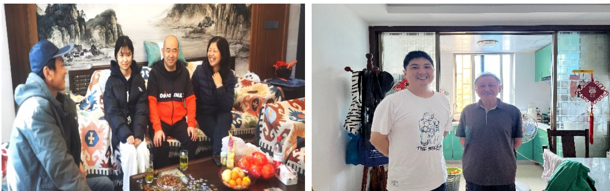
图 3-7 班主任入户家访活动