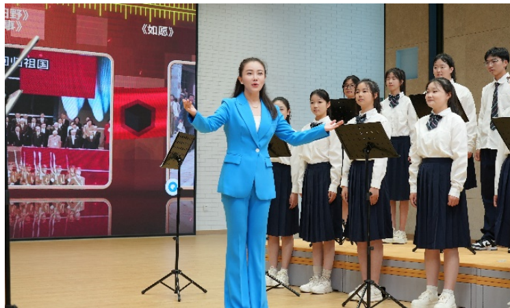
图 1-2 学校骨干教师教学展示活动