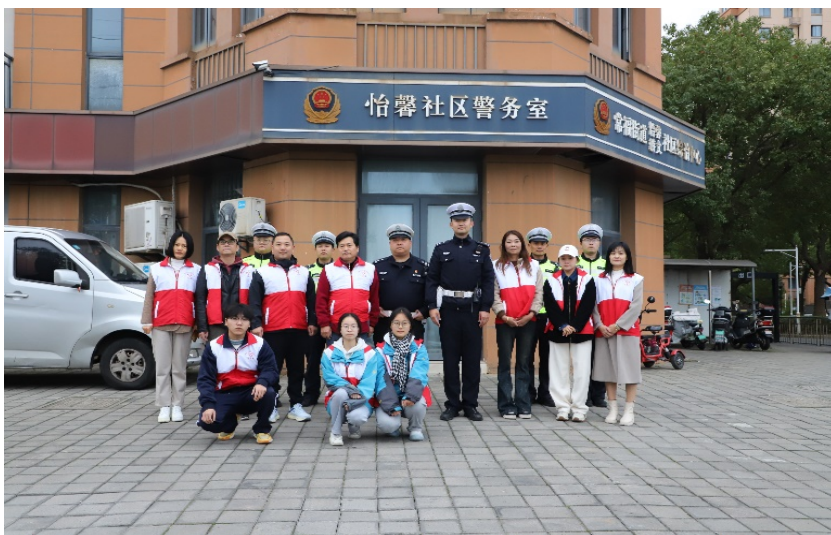
图 3-5 “校、警、社、家、生”五方联动铸牢安全防线