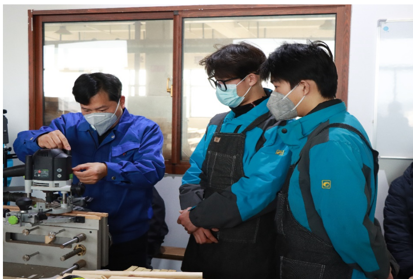
图 2-6 学校专业教师参加职普融通跨界教学展示

格的拼装技艺”主题教育活动。活动分“格角榫”花窗格的加工技术、榫卯结构的力学特性、木材特性与生长环境、走进花窗格现代智造和课后拓展五个模块。各校老师各自发挥专业所长，深入浅出地为学生、家长、社会展示精彩纷呈的教学内容，为弘扬古建营造技艺，传承非遗工艺并创新发展贡献力量。