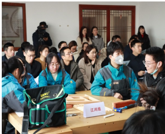
2-5 中职、普高师生共同参加职普融通跨界课堂教学活动

为提升教师教科研能力、引领教学改革新风尚。学校主办江苏省教育科学“十四五”规划 2024 年度重点课题《学习空间再造视域下职普学校跨界融通的实践研究》研究活动。国家“万人计划”教学名师崔志钰博士、教育局教学研究室领导和苏州市“跨界·共生教学创新”好教师团队成员参加活动。活动以其独特的研究视角，瞄准当前职业教育体系建设改革的热点问题，积极探索职普融通和产教融合的新路径。明晰课题的研究内容和研究策略，有力推动职普学校在课程、教学、资源和基地之间的得融合沟通，促进育人方式的有效转变，集聚“职业教育服务普通教育、普通教育反哺职业教育”的实践经验，赋予职普跨界融通的时代内涵。