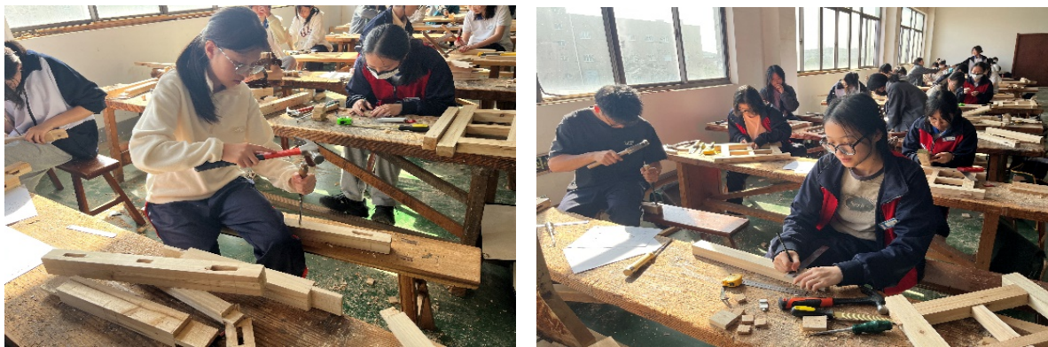
图 4-3 工艺美术(家具)专业学生实训基地实践场景

3. 共建培训基地。学校与江苏百成汇服饰有限公司共建的“百成汇智能化服饰”培训基地，因在校企合作模式创新和培训实效提升方面的显著成效，被认定为常熟市“双师型”教师培养培训基地。