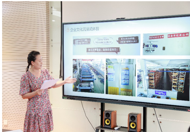
图 2-4 专业教师下企业期末考核汇报