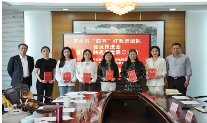
图 1-1 “跨界·共生教学创新”好教师团队课堂展示活动