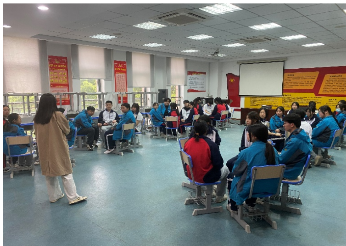
图 3-10 学校学生参加心理团辅活动

4. 潜能发展。学校举办《打开心窗，拥抱阳光》《新学期，“心”世界》两场主题讲座，以专业视角为学生拨开心理迷雾；组织了《关于幸福》《破茧逐光，中职生的挫折突围之旅》等多场心理主题班会，通过互动讨论引导学生深入思考内心世界。心理运动会、欢乐套圈等趣味性活动，为学生打造了课余放松身心的理想场所，不仅有效缓解了学习压力，更为校园生活注入了蓬勃活力。