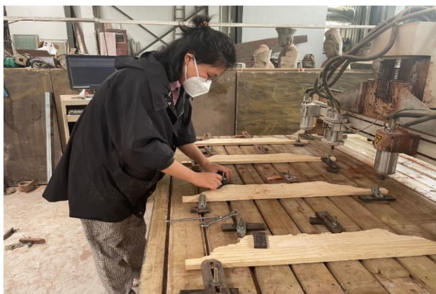
图 2-3 专业教师企业跟岗实践

型”教师队伍建设精神。通过政策引领、实践赋能、认定驱动三维举措，系统化打造高素质师资队伍，以双师队伍建设赋能学校高质量发展。学校以专业教师下企业提升实践技能为抓手，实行学校选派和教师自主选择企业实践相结合。完善《专业教师下企业实践管理办法》，构建校企协同考核机制，实施技能等级提升计划，推动“新材料、新工艺、新方法”融入教学。依托江苏省“双师型”教师认定工作，对标认定标准，统筹推进教师能力达标工作，夯实专业教师双师素养根基。近三年学校遴选 41 名专任专业教师深入企业跟岗实践，实践考核优良率达 100%。教师自主选择企业实践达 150 人次；职业技能等级高级工及以上教师 92 人，其中技师及高级技师 47 人；73 名专业教师完成双师认定，高级双师型教师占 38.35%。