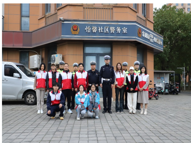
图 3-2 “校、警、社、家、生” 五方联动铸牢安全防线

五是家校社合作，通过家长会、告家长书、微信公众号等，向家长传递安全知识，形成教育合力。同时与公安、消防、卫健等部门合作，引入专业力量。以交通安全为例，针对学生不戴头盔、改装电摩飙车等安全问题，学校联合常福交警中队、家委会、社区及学生志愿者，开展五方联动“学生安全出行”专项整治活动。2025 年共开展 8 场“交通安全”定制化讲座，10 次专项整治行动，纠正违规行为 60 余起。学生在一系列活动中养成了文明出行习惯，提高了生命安全与责任意识，铸牢了“先成人、再成才”的底线。