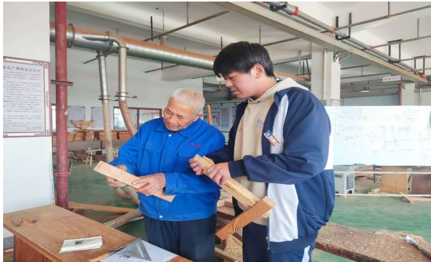
图 2-1 非遗传承人、产业导师指导学生