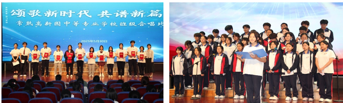
图 3-8 颂歌新时代，共谱新篇章班级合唱比赛

学校围绕“实践育人”总体要求，以主题教育月为活动载体，强化学生理想信念教育、民族精神教育、文明礼貌和行为规范养成教育、法制教育，引导学生在活动中获得道德体验，养成文明习惯，提高思想素质。充分利用每年的重大节庆日、重要事件和重要人物纪念日，开展各种主题教育活动，激发学生爱国情感。