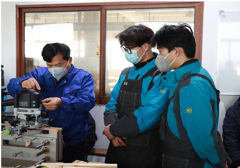
图 2-5 专业教师参加职普融通跨界教学展示