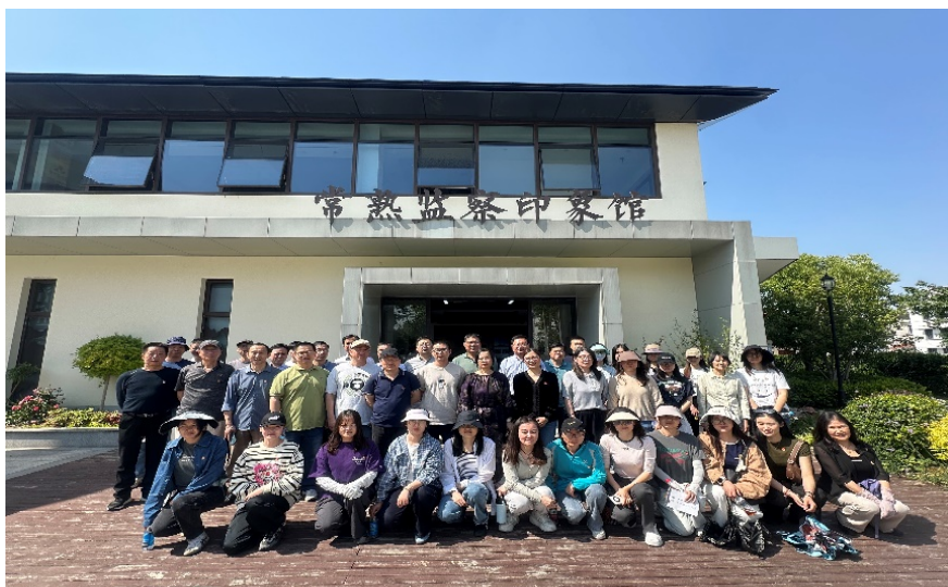
图 7-1 学校全体党员参观常熟监察印象馆

构建“党建+”工作体系，推动党建工作与中心任务深度融合。一是建立“党建+育人”模式，以“书记项目”为抓手，深化产教融合，破解产教融合教育过程中“合而不融、融而不深”的难题，为服务地方产业发展、培育发展新质生产力、推动经济社会高质量发展贡献力量。创新开展党员责任区“1+N+1”结对帮教活动，从思想引导、学业辅导、生活指导、心理疏导、双创助导这五个方面关爱学生，将党建优势化为育人实效。二是深化“党建+共建”，与怡馨社区党支部建立结对，通过思想共建、活动共办、党员志愿者安全巡查等，形成协同发展合力，拓展社会服务功能。如邀请怡馨社区钱书记来校做“传承红色基因，缅怀革命先烈”专题讲座；组织党员志愿者于周五放学时段在校园周边开展安全巡查，守护学生安全。