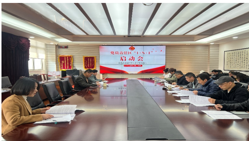
图 7-2 学校党员责任区 1+N+1 启动会

践成效显著，所帮扶学生的纪律意识、学习主动性明显提升。党员教师在责任区内充分发挥先锋模范作用，该模式将党建优势转化为育人实效，形成“党员带头、全员参与、协同推进”的育人新格局。