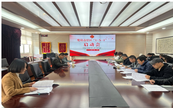
图 5-1 党员责任区“1+N+1”启动会