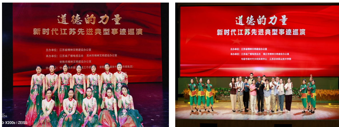
图 5-1 舞蹈专业学生参加“道德的力量”新时代江苏先进典型事迹巡演

巡演活动。以舞蹈形式展现周维忠、张景宏、殷志兰、端木银熙等先进典型的事迹和精神，推动全社会见贤思齐、崇尚劳模、争做先锋。