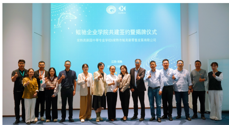
图 4-1 鲲驰企业学院签约暨揭牌仪式

展工学交替。工学交替模式既解决学校教育理论与实践脱节问题，又为企业人才储备注入新鲜血液，提升企业社会责任形象，为企业发展注入活力。以电子商务专业为例，学校与鲲驰集团共建鲲驰企业学院。学生参与该企业“6·18”“11·11”“12·12”等网络电商节的售前客服、网上销售、售后服务。2024 年累计服务 35 天，创造 1500 多万元的销售额，客户满意度 95%；2025 年累计服务 32 天，创造 1055 多万元的销售额，客户满意度 94.49%。学生服务质量及服务能力都得到大幅提升，受到服务企业的广泛好评。