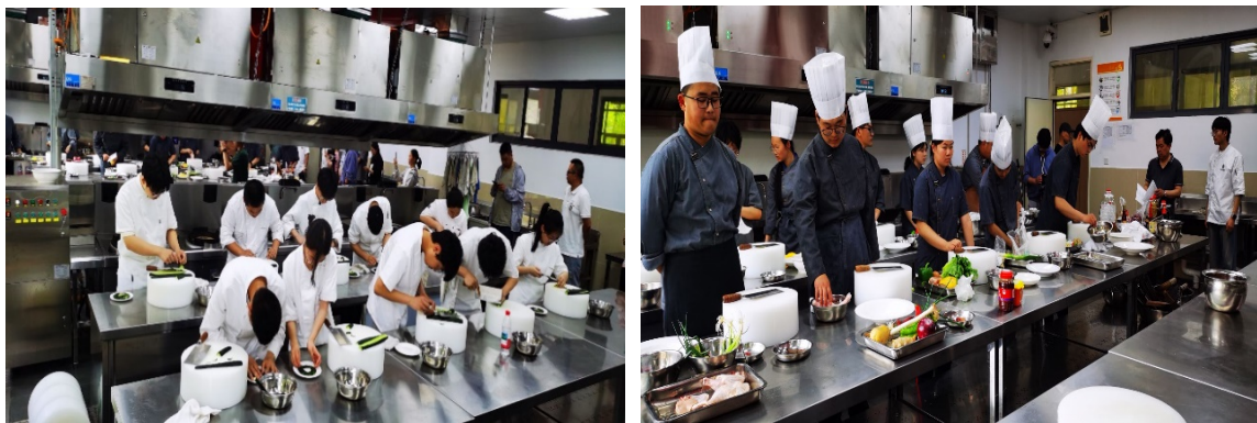
图 3-15 学校举办“知‘食’·育心”技能大比拼活动

根据苏州市技能学考安排，本年度学校承担美术类、商务营销类（电子商务方向）、导游服务类考点工作，有序组织服装类、机械类（机械装备方向）、机电类等 348 名学生赴张家港中等专业学校、张家港市第三职业高级中学等多校进行技能学考，本学期共组织了 781 名学生完成省学业水平考试。全校全科合格率达 95.45%。在 2024 学年度，有 198 位学生参加多项职业技能等级考证，涉及数控技术应用、工艺美术、服装设计与工艺、网店运营推广、研学旅行策划与管理等领域 7 个项目，通过人数 196 人，通过率达 98.98%。