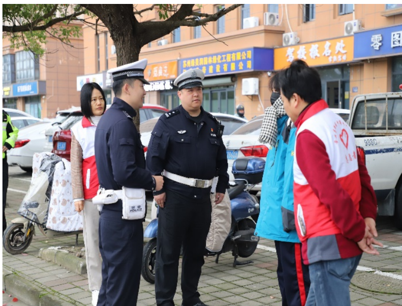
图 3-6 “校、警、社、家、生”五方联动进行专项整治