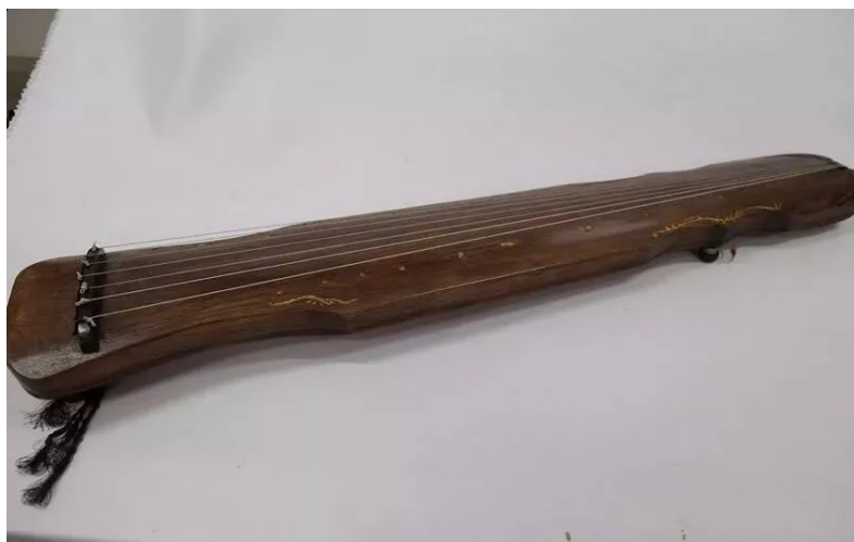
图 2-4 工艺美术专业学生邹梦娜木作作品—古琴《悠然亭声》

学校与常熟市鲲美新零售发展有限公司联合成立鲲驰企业学院，同步新建客服实训室、电商直播实训室等 9 个实践教学空间。