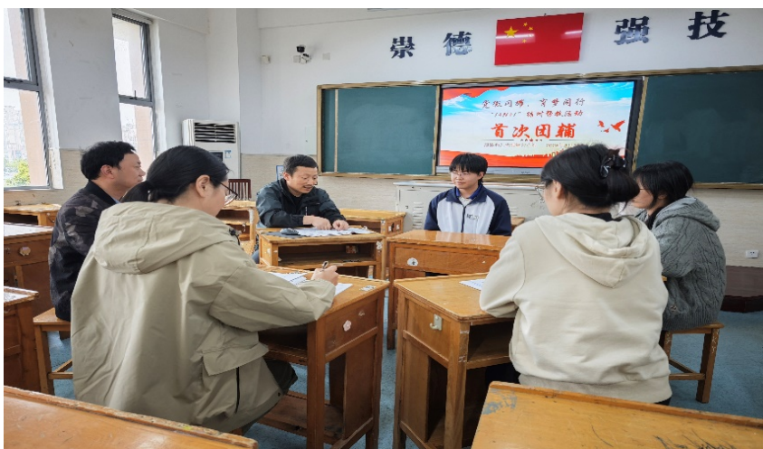
图 7-3 学校 1+N+1 党员结对帮教集体辅导