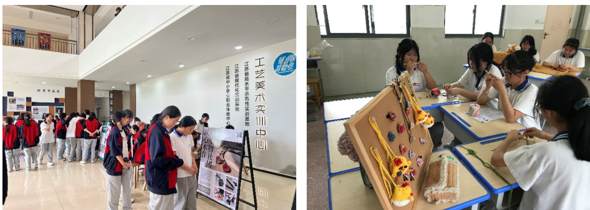
图 3-11 学校 2025 年学生社团招新及社团活动

竞技、实践创新、心理成长四大类别，包括“妙笔生花”书法社团、“翰墨飘香”书法社团、匠心木作小物社团、百巧灯彩社团、小草莓工作室、云顶篮球社、羽毛球社团、“舞动青春”舞蹈社团、红豆合唱社团、“馨悦”常熟花边 DIY 社团、青苹果心理剧社团、愈见心理社团、足球社、“鼎中和”烹饪社团等。各社团以“兴趣为引、能力为基、成长为核心”，常态化开展书法创作、传统手工艺传承、体育竞技、艺术展演、心理赋能等特色活动，既传承了中华优秀传统文化与地方特色技艺，又满足了学生多元发展需求，为学子搭建了展示自我、切磋技能、结交挚友的广阔舞台。其中，“舞动青春”舞蹈社团凭借扎实的训练成效、精彩的舞台表现和良好的校园影响力，荣获苏州市职业学校优秀社团称号，成为学校社团建设的标杆典范。