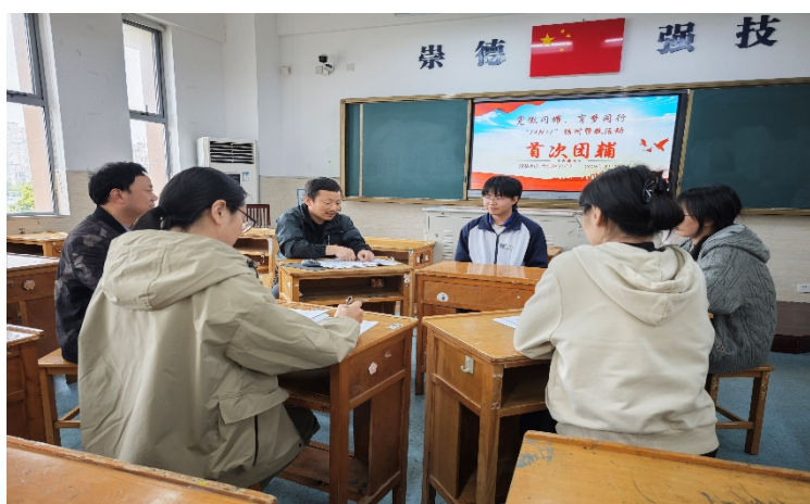
图 5-2 “1+N+1”党员结对帮教集体辅导