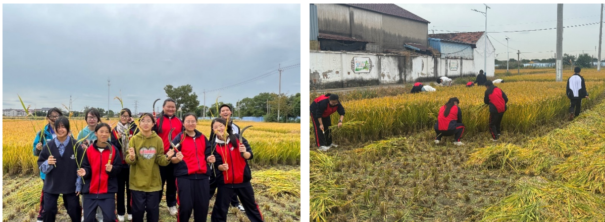
图 3-3 学生在“村之恋”校外劳动教育基地参加劳动实践