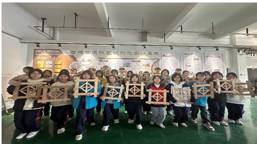
图 2-6 学生参加职普融通跨界课堂教学活动