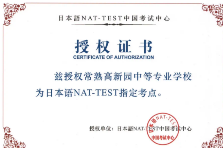
图 6-1 日语 NAT-TEST 指定考点授权证书