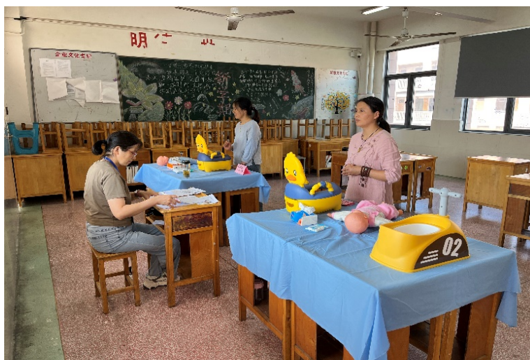
图 4-3 婴幼儿发展引导员（育婴师）培训、认证

常熟高新园中等专业学校秉持“以服务求发展，以贡献促提升”的服务理念，发挥职业技能等级认定考核点的作用，打造“职教惠民”品牌。对接社会民生需求，聚焦“一老一小”服务领域开展服务。一是通过承办各类职业技能竞赛，服务地方产业发展；二是开展紧缺工种的培训与认证，包括婴幼儿发展引导员、家政服务员、餐厅服务员、整理收纳师等。服务覆盖家庭、社区等多个场景。通过“理论+实操+岗位实训”培养模式，使学员系统掌握职业技能，提高解决实际问题能力。近三年，完成 28 批次共 2165 人次培训，考核合格率达 90%以上。学校将继续深化职业教育改革，围绕康养、育幼等领域拓展培训项目，为提升城市生活品质、推动服务业发展提供人才与技术支撑。