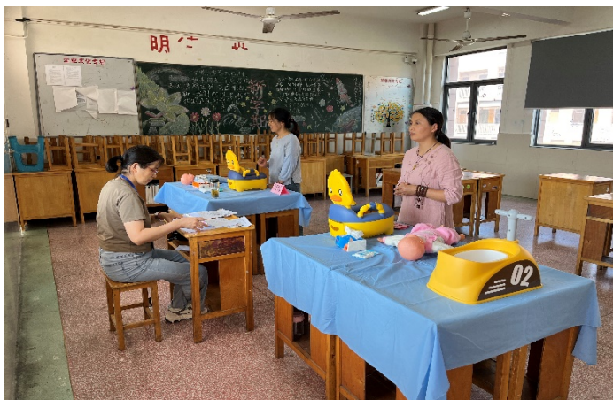
图 4-4 婴幼儿发展引导员（育婴师）技能竞赛现场