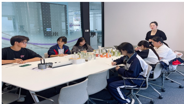
图 4-2 电商专业学生参加企业学院“工学交替”岗前培训

2. 实施产教融合共同体项目。学校与常熟古建园林股份有限公司携手合作，共同推进工艺美术行业产教融合共同体项目建设。双方协同打造高水平实习实训基地，有效提升了学生的实践操作能力和职业素养，同时推动了地方传统文化与现代产业的深度融合，助力区域特色文化产业高质量发展。