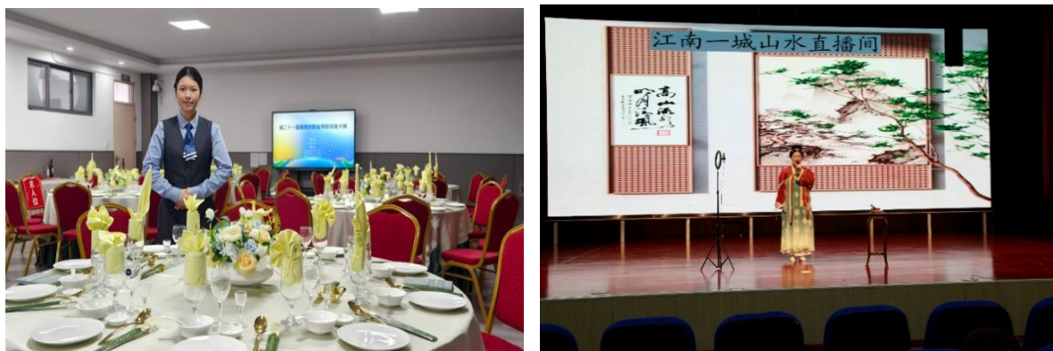
图 3-5 学校旅游类专业学生参加技能大赛现场

常熟高新园中等专业学校坚持以赛促教、以赛促学，把技能竞赛作为驱动教学改革和提升学习成效的重要抓手和平台，构建一个完整的“教-学-赛-改”教学生态。通过赛教融合，建设课程体系；通过教学过程，模拟竞赛场景；通过分级指导，构建递进式竞赛体系；通过内部培养，外部引进，打造“双师型”竞赛指导团队。以赛促教、以赛促学成功地将竞争机制、前沿标准和成果导向引入到教学过程中，取得良好的教学成果。在 2025 年省、市技能大赛中，学校学生共获江苏省级奖 6 项、苏州市级奖 17 项。在 2024 年江苏省学业水平考试中，学生专业技能合格率达 98.66%，全科合格率达 95.45%，人才培养质量有了显著提升。