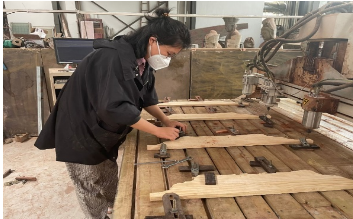
图 2-7 专业教师企业跟岗实践