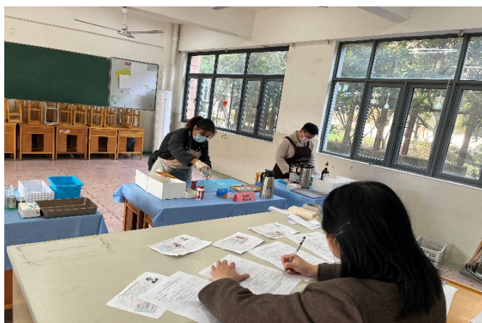
图 4-5 家政服务员培训、认证