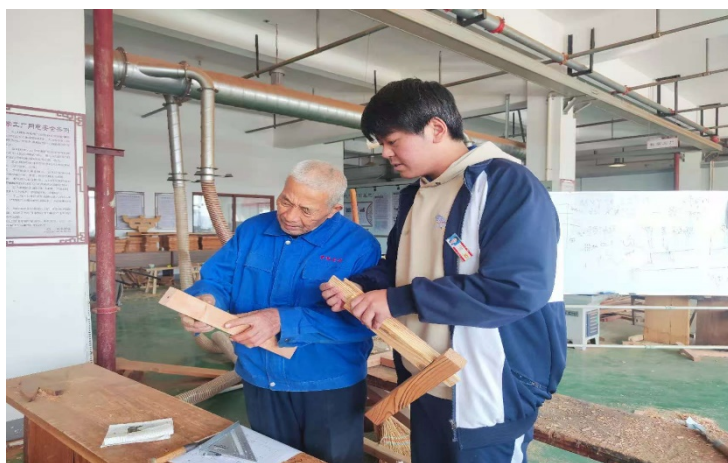
图 2-1 非遗传承人、产业导师指导学生

了理论与实操技能，进入企业后，凭借勤勉、专注成长为青年工匠。在 2025 年传统建筑工匠技能邀请赛中获江苏赛区一等奖。未来，学校将继续深化校企合作，优化协同育人模式，夯实实践课程、搭建竞赛孵化平台，为传统建筑行业培养更多高素质技能人才，助力文化传承与行业发展。