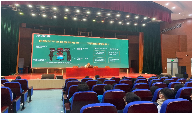
图 3-4 学校法制副校长开展“远离校园欺凌，共建阳光校园”讲座