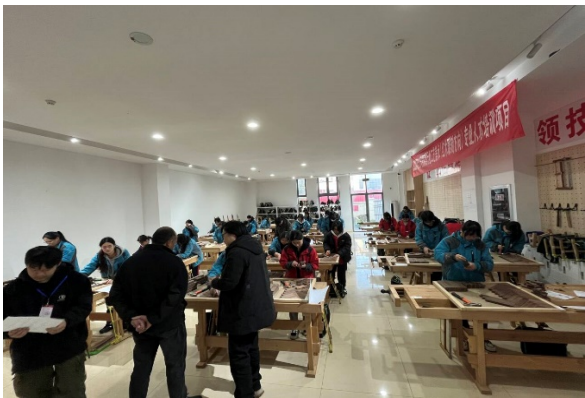
图 3-14 学生参加装饰美工（中级）和手工木工（中级）考证