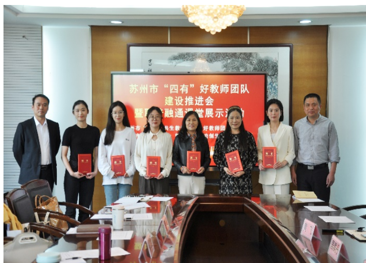
图 1-1 学校“跨界·共生教学创新”好教师团队课堂展示活动

每位教师配备骨干教师或工匠大师作为导师,筑牢教师成长之基;三是实施“教师企业实践工程”。学校遴选教师深入企业,参与生产、研发、产品升级等工作,实现“产”、“教”同频共振;四是实施“名师培育工程”。以“培育骨干、辐射带动”为目标,通过“选拔、培养、赋能”三步打造高水平教师团队。近三年,教师培养成效显著,现有常熟市级以上骨干教师 111 名,常熟市学科带头人及以上骨干教师 47 人;73 位老师被认定为“双师型”教师,其中高级双师型教师比例达 38.35%;教师企业实践获国家专利 1 项;教师团队获省、市教学成果二等奖各 1 项。