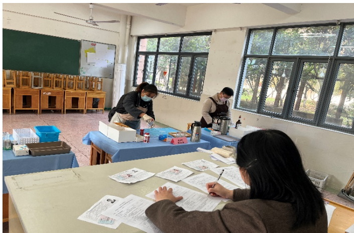
图 4-4 家政服务员培训、认证