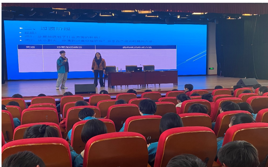
图 3-9 学生参加马素红老师心理讲座

盖情绪管理、人际交往、压力释放等多个重要主题，助力学生提升应对学习与生活挑战的能力。