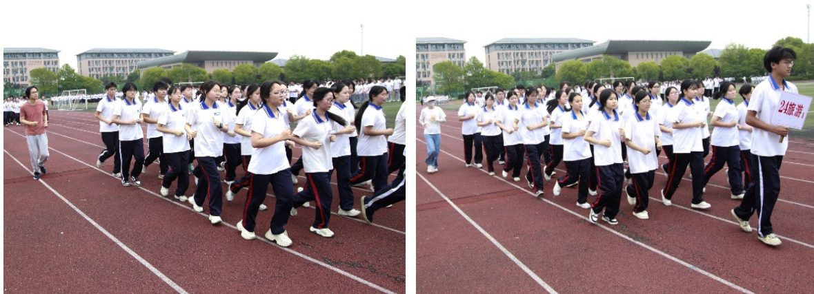
图 3-17 学生参加常熟市 2025 年中小学阳光大课间比赛活动

评为“劳动达人”称号。在常熟市 2025 年中小学阳光大课间活动比赛中，学校荣获高中组第一名。