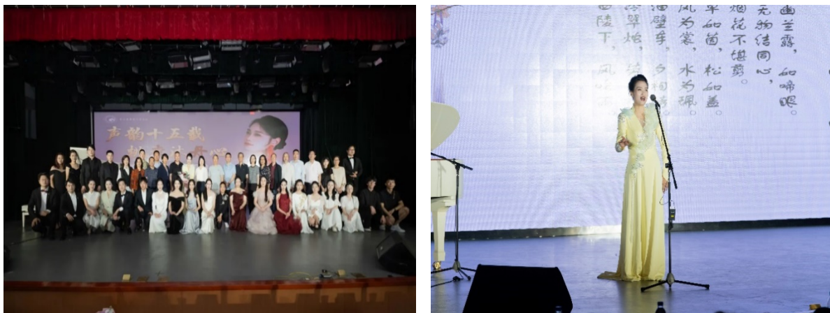
图 3-13 声韵十五载，桃李沐丹心师生音乐会