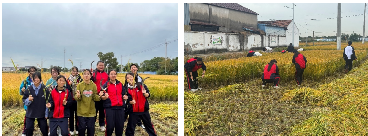
图 3-1 学生在“村之恋”校外劳动教育基地参加劳动实践

专业指导下参与播种、灌溉、采收等农事操作；“感触”劳动艰辛，在实践中磨练吃苦耐劳意志；“感悟”劳动价值，树立“劳动最光荣”的职业理念。实践活动突出“真实、跨界、融合”创新点，构建“以劳树德、以劳增智、以劳强体、以劳育美、以劳创新”劳动教育模式，有效提升学生劳动意识、习惯、能力与认同，让学生在实践中锤炼品格、增长才干，为培育新时代工匠筑牢思想根基。