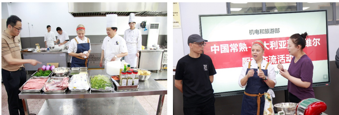
图 6-3 中澳柬厨艺文化交流活动

为提升学校在国际职业教育与行业发展中的影响力，促进多元文化的融合与发展，在“常熟市人民友好使者”西蒙·米尔考克先生协助下，学校与澳大利亚国际厨师协会签署合作备忘录，组织中澳厨艺文化交流活动，邀请澳洲名厨来校开展烹饪大师课，建立年度互访机制。同时，与柬埔寨公益烹饪组织 Spoons 达成合作意向，拟订“中柬烹饪技能帮扶计划”，计划为柬埔寨青年厨师开展中餐烹饪技能培训，尝试开发融合两国饮食文化的创新菜品。