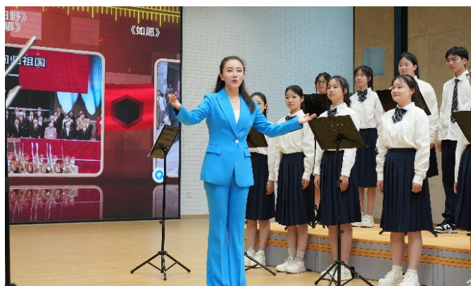
图 1-2 骨干教师教学展示活动